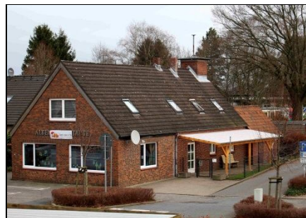
Krippenplätze in der Altentagesstätte

Die Gemeinde schuf zehn weitere Krippenplätze, zunächst in der Altentagesstätte.