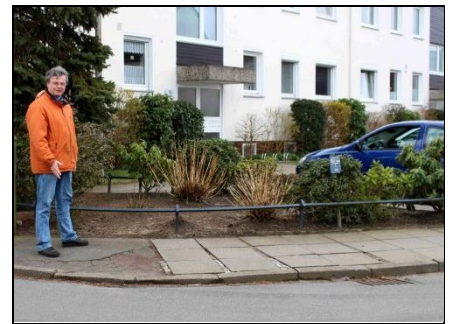
Auf einem Rundgang durch Bönningstedt

Ich biete Rundgänge durch Bönningstedt (aktuell im April/Mai 2016) und weiterhin eine regelmäßige Sprechstunde bei Ihnen zu Hause an.